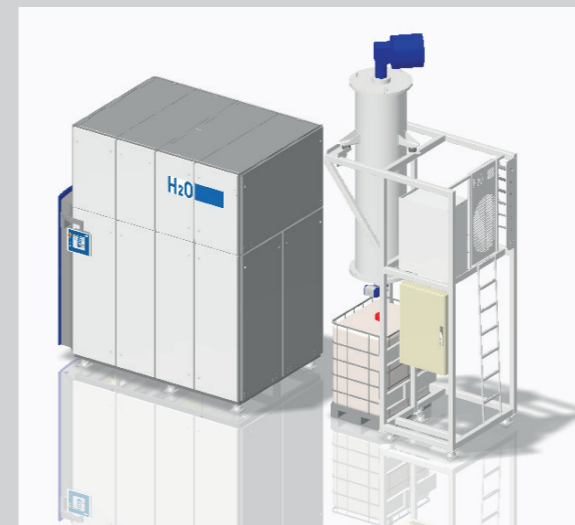
减少多达50%的废物处理成本